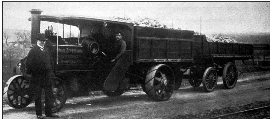
Foden-Dampfplastwagen der Firma Alfred Schwefringhaus 1911

Der Beginn des ersten Weltkriegs bereitete dem Asdomobil ein Ende.