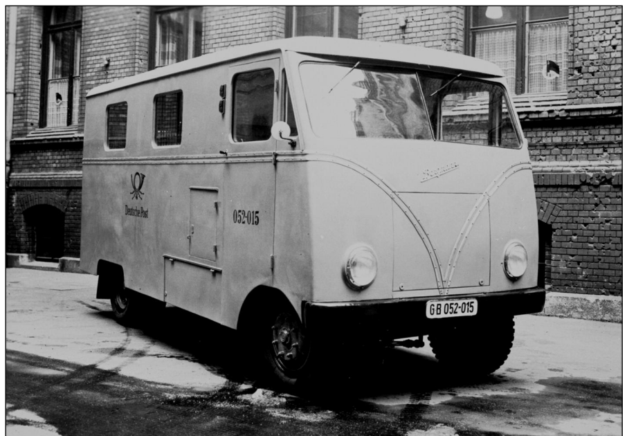
Am 16. Februar 1952 erhielt die Deutsche Post Berlin diesen modernen Elektrowagen auf Bergmann-Borsig-Fahrgestell zur Probe 3

Im VEB Bergmann-Borsig wurden vermutlich nach Kriegsende und in den frühen Jahren der DDR aus Restmaterialien des > Bergmann-Werks in Berlin-Wilhelmsruh noch Fahrzeuge gebaut. Über diese Epoche ist jedoch außer Abbildungen mit modernem oder modernisiertem Frontlenker-Blechkleid nichts bekannt.