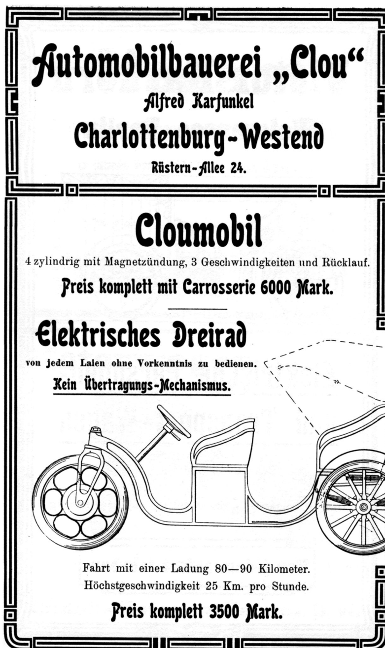
Werbung von Clou 1908 1