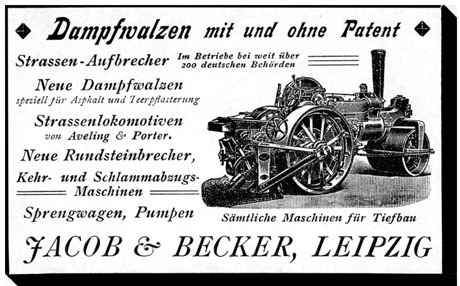
Jacob & Becker warb für Dampf Fahrzeuge 1