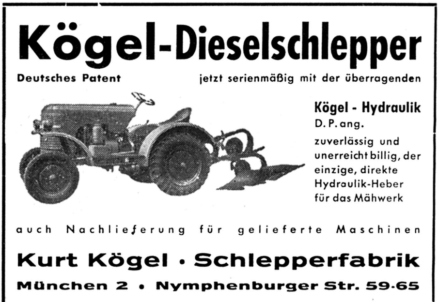
Kögel Werbung 1952 1