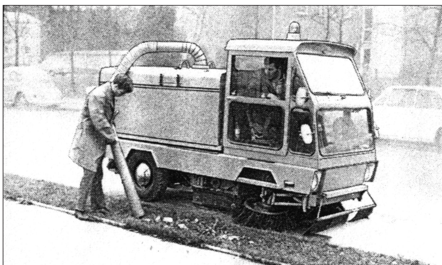
Kibo Typ 1600