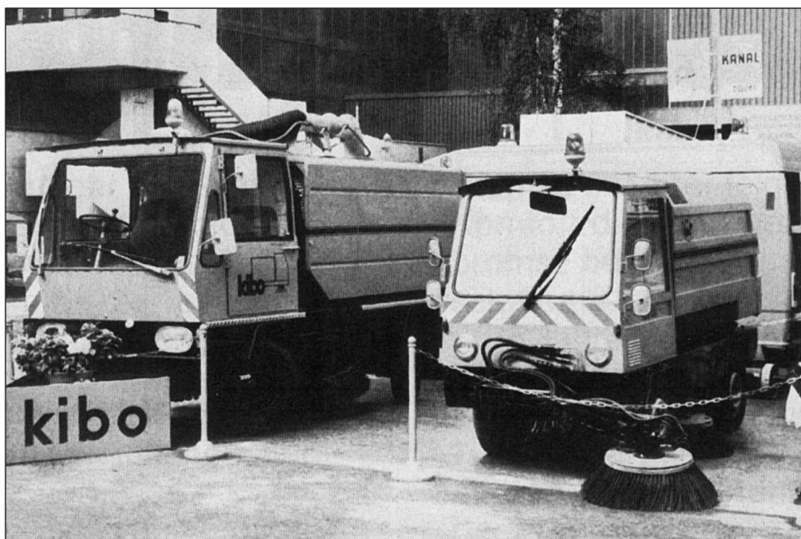
Kibo 1980: Straßenkehrmaschinen Typ 3000 und 1000

Basis für den Typ 2500 war ein Mercedes-Benz. Typ 5500 auf einem Magirus-Deutz-Fahrgestell.