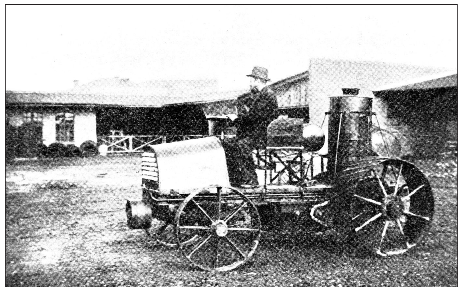
Lehmbecks Trakteur 1902 1