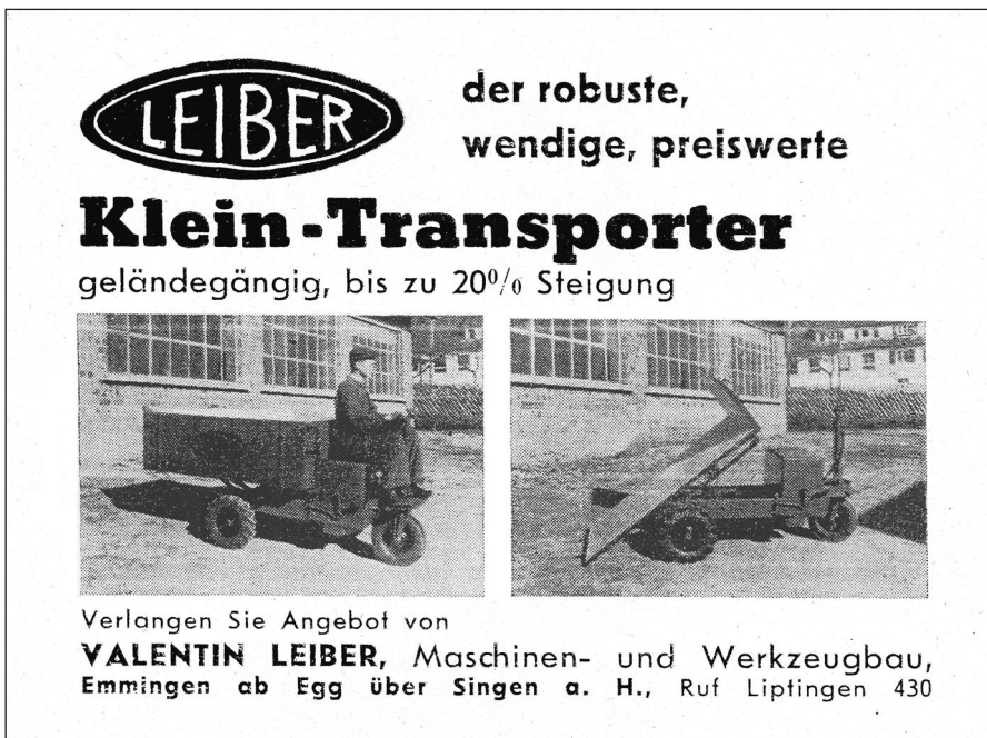
Leiber-Werbung 1960 in der Zeitschrift „Die neue Landschaft“