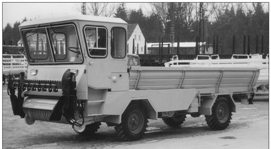
Das Mehrzweckfahrzeug der Firma Lely-Dechentreiter Typ LT 7