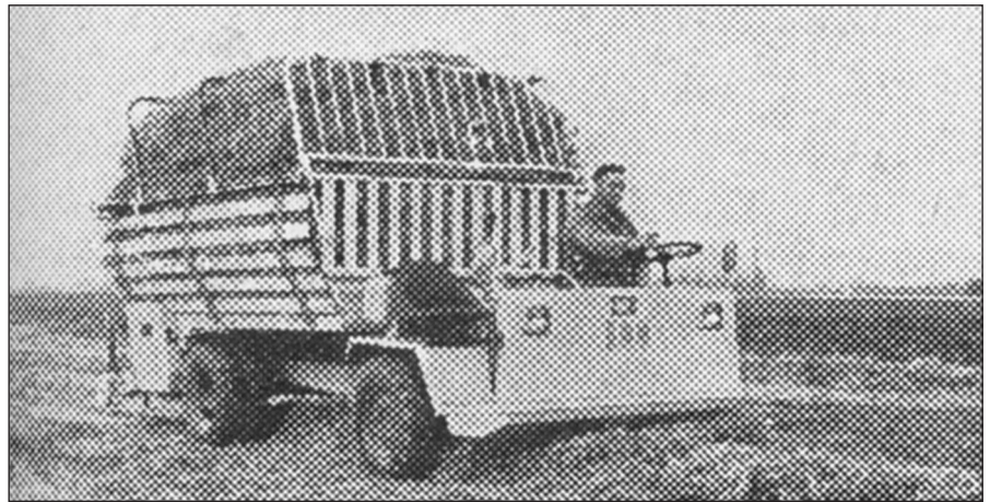
Lely-Dechentreiter Typ LT 3

Die Maschinenfabrik Lely-Dechentreiter GmbH, 8854 Asbach-Bäumenheim, brachte 1968 ein einem Lkw sehr ähnliches Mehrzweck-Fahrzeug für die Landwirtschaft auf den Markt. Es wurde nach Patenten des Niederländers Cornelis van der Lely, Maasland (Niederlande), gebaut.