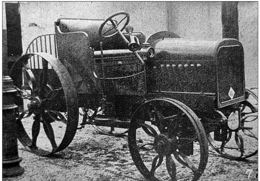
MAF-Schlepper 1916 1