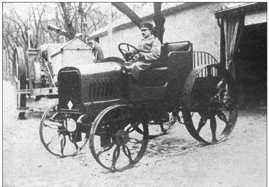
MAF-Schlepper 1916 1