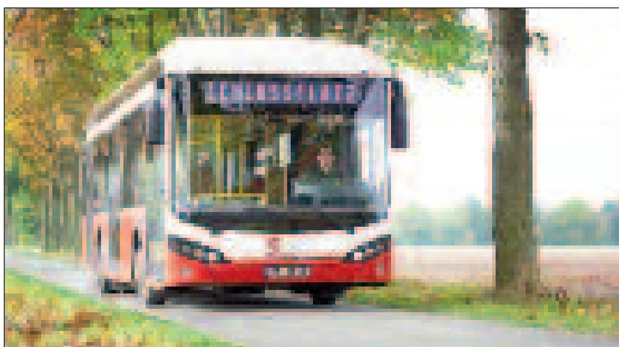
Sileo E-Bus S 12

Das Unternehmen ging aus dem 1989 von dem Ingenieur Murat Bozankaya in Wolfenbüttel gegründeten Entwicklungs- und Ingenieurbüro Bozankaya Business Consultant & Commerce (BBC & C) hervor. 1997 erfolgte in Wolfenbüttel die Bozankaya Metall & Kunststoff GmbH, die später nach Salzgitter umzog. Vom Konstruktionsbüro entwickelte man sich zum Systemlieferanten für die Fahrzeugindustrie. 2010 gründete man in Ankara (Türkei) die Turkish Commercial Vehicles (TCV), womit man selbst in die Busproduktion einstieg. TCV stellte im Frühjahr 2012 einen Stadtbus als erstes Produkt vor. Auf dieser Konstruktion basieren auch die Elektrobusse von Sileo.