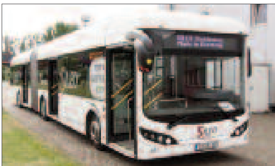
Sileo Ebus S 18