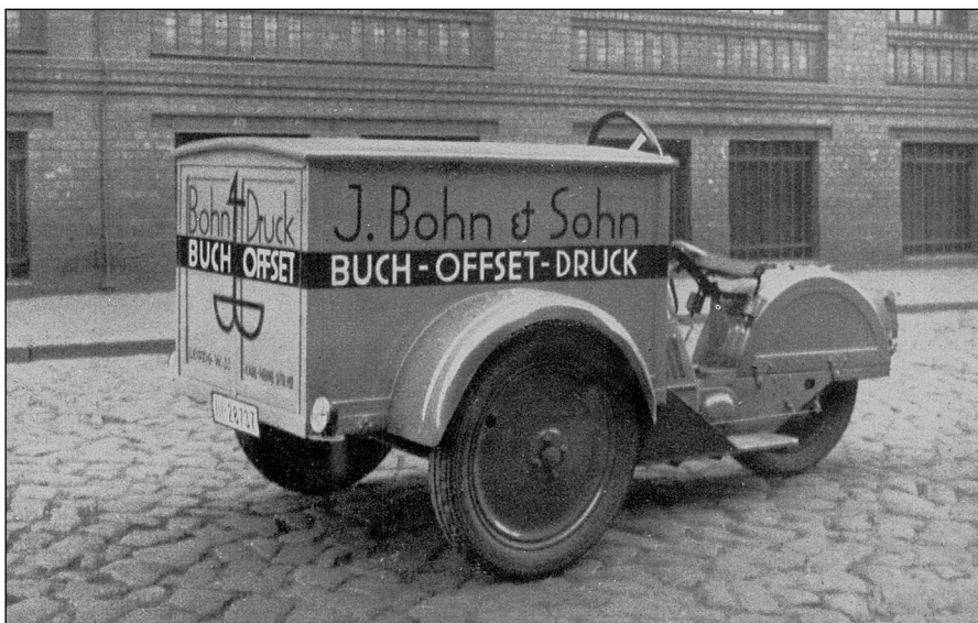
10-PS-Steigboy-Kastenwagen 1928 1